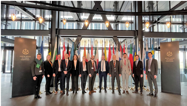
Teilnehmer des VII. Exzellenz Programms Europa.

Das Exzellenz Programm Europa bildet vielseitig und international einsetzbare Europa-Experten aus. Führungskräfte in der öffentlichen Verwaltung erweitern ihre fachspezifischen Kompetenzen und sprachlichen Kenntnisse.