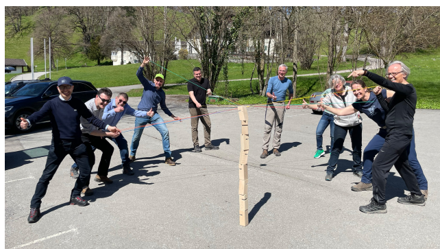
Teilnehmerinnen und Teilnehmer TOP Management Programm beim Outdoor-Teambuilding.

Mit dem TOP Management Programm sensibilisiert die Bayerische Staatsregierung die Spitzenführungskräfte der öffentlichen Verwaltung mit Seminaren und Informationsreisen für gesellschaftliche, wirtschaftliche und politische Entwicklungen. Die Teilnehmer bauen ihre Führungskompetenzen gezielt aus.