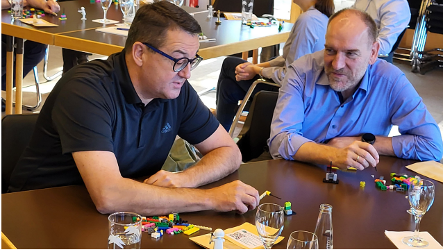
Teilnehmer des Digital Governance Programs

Das berufsbegleitende Digital Governance Program wurde speziell für stellvertretende Abteilungsleiterinnen und stellvertretende Abteilungsleiter der obersten bayerischen Dienstbehörden konzipiert. Die berufsbegleitende Seminarreihe bereitet die Teilnehmenden darauf vor, die digitale Transformation der Verwaltung aktiv zu gestalten und Führungsverantwortung zu übernehmen. Gleichzeitig dient das Programm der Netzworkebildung innerhalb der bayerischen Verwaltung und dem Aufbau von professionellen Kontakten über die Landesgrenzen hinaus.