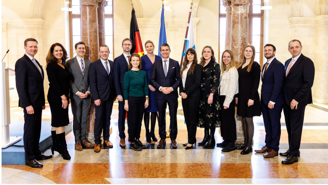
Teilnehmer des VII. Exzellenz Programms Europa.

Das Exzellenz Programm Europa bildet vielseitig und international einsetzbare Europa-Experten aus. Führungskräfte in der öffentlichen Verwaltung erweitern ihre fachspezifischen Kompetenzen und sprachlichen Kenntnisse.