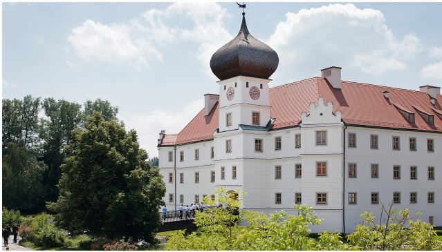
Schloss Hohenkammer.

Das Internationale Seminar wird alle zwei Jahre von der Bayerischen Staatskanzlei in Kooperation mit dem Generalkonsulat der Vereinigten Staaten von Amerika und einem weiteren Gastland organisiert. Es präsentiert renommierte Referentinnen und Referenten und behandelt aktuelle, grenzüberschreitende Themen. Das Ziel ist die Förderung der internationalen Kompetenz der bayerischen Ministerialverwaltung. Die Arbeitssprache ist daher Englisch.