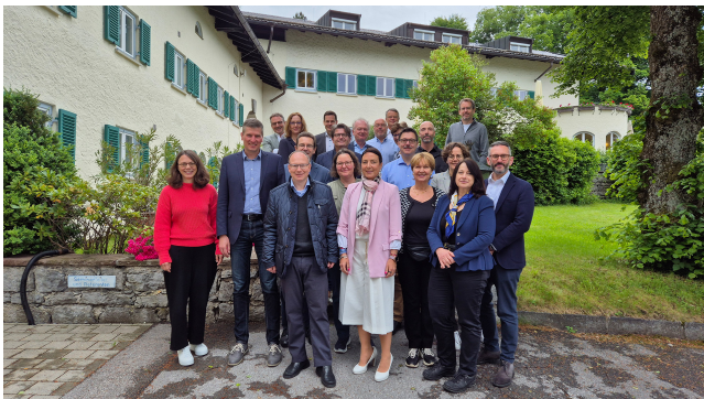
Teilnehmer des Digital Governance Programs

Das berufsbegleitende Digital Governance Program wurde speziell für stellvertretende Abteilungsleiterinnen und stellvertretende Abteilungsleiter der obersten bayerischen Dienstbehörden konzipiert. Die berufsbegleitende Seminarreihe bereitet die Teilnehmenden darauf vor, die digitale Transformation der Verwaltung aktiv zu gestalten und Führungsverantwortung zu übernehmen. Gleichzeitig dient das Programm der Netzworkebildung innerhalb der bayerischen Verwaltung und dem Aufbau von professionellen Kontakten über die Landesgrenzen hinaus.