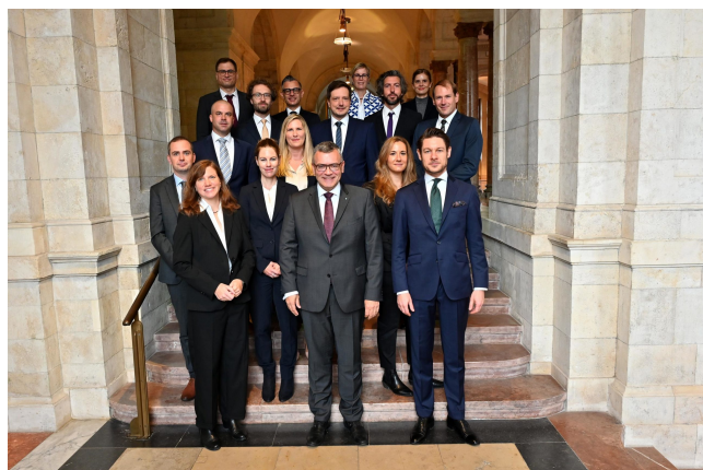
Gruppenfoto des 29. Lehrgangs für Verwaltungsführung.

Dauer: 10 Monate, die Teilnehmer sind für den Zeitraum des Lehrgangs vom Dienst freigestellt.