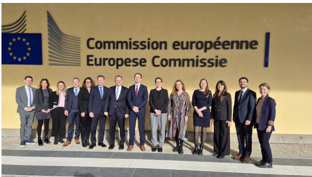
Gruppenbild der Teilnehmer des Exzellenz Programms Europa.