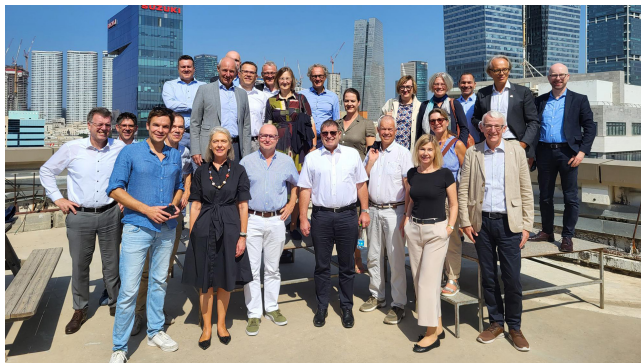
Gruppe des X.TOP Management Programms beim Besuch des ARD-Studios in Tel Aviv.