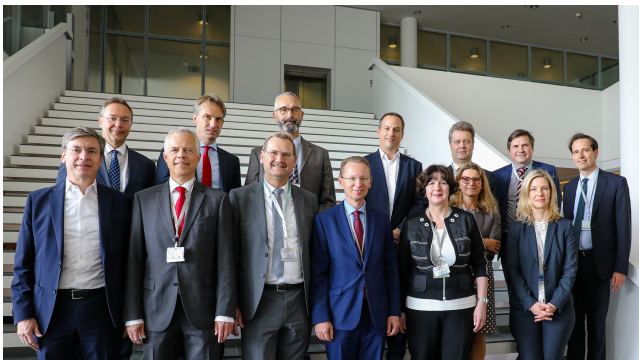
Gruppe der Personalabteilungsleiter bei der Infineon Technologies AG.