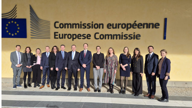
Photo de groupe des participants au Programme Excellence Europe.