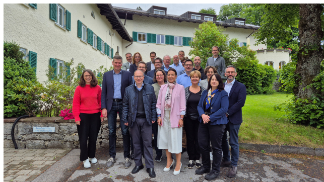
Participants au Programme Digital Governance (Gouvernance numérique)

Le programme Digital Governance (Gouvernance numérique) en cours d'emploi a été spécialement conçu pour les chefs de service adjoints des plus hautes autorités de service bavaroises. La série de séminaires en cours d'emploi prépare les participants à concevoir activement la transformation numérique de l'administration et à assumer des responsabilités de direction. En même temps, le programme sert à créer un réseau au sein de l'administration bavaroise et à établir des contacts professionnels au-delà des frontières du Land.