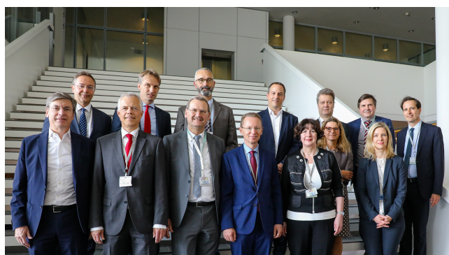
Groupe des Directeurs de Ressources Humaines de Infineon Technologies AG

Le programme de rencontre « Construire des ponts » s'adresse à des Directeurs de Ressources Humaines de Départements. Lors de rencontres informelles les Hauts fonctionnaires, ayant des responsabilités d'encadrement, s'entretiennent avec leurs homologues dans des organisations non étatiques des entreprises leaders. Parallèlement, ces rencontres offrent également l'opportunité de réaliser des échanges sans contraintes avec des collègues provenant d'autres secteurs publics.