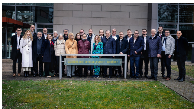
XI. Programme TOP Management à la Führungsakademie der Bundeswehr à Hambourg.

Durée : quatre séminaires de deux jours et demi échelonnés sur une période d'une année et demi