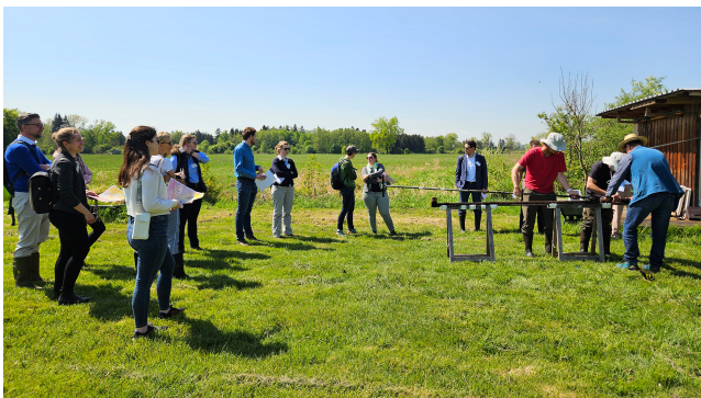
A la pointe du progrès – série de formation pour haut fonctionnaires bavarois en missions spéciales.

Les lieux variables de ce séminaire permettent d'avoir un aperçu du contexte culturel, scientifique et d'autres institutions dignes d'intérêt.