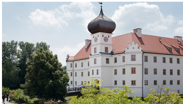
Schloss Hohenkammer

Le séminaire international est organisé tous les deux ans par la Chancellerie de l'État de Bavière en coopération avec le Consulat général des États-Unis d'Amérique et un autre pays invité. Il présente des intervenants de renom et traite des sujets transfrontaliers d'actualité. L'objectif est de promouvoir les compétences internationales de l'administration ministérielle bavaroise. Pour cela, la langue de travail est l'anglais.