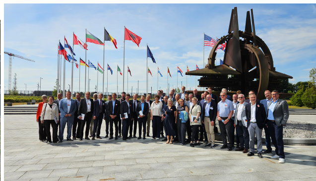
Participants de Bavière et du Bade-Wurtemberg dans le cadre du séminaire Hallstein lors de la visite de l'OTAN à Bruxelles.