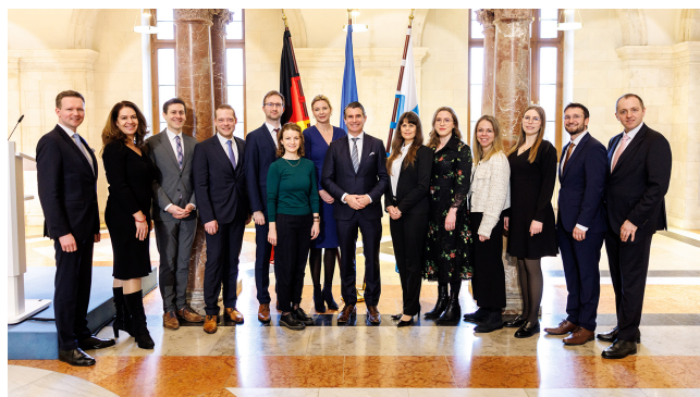
Participants au VIIe Programme Excellence Europe

La formation continue « Excellence EUROPA » permet aux cadres de la fonction publique de devenir des experts en connaissances européennes et d'être polyvalents. L'intensité d'apprentissage leur permet d'améliorer leurs compétences linguistiques mais aussi d'élargir leurs connaissances spécifiques.