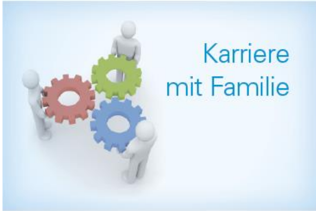
Logo programme de mentoring

Le gouvernement bavarois a établi avec le pacte familial bavarois un signal pour améliorer la compatibilité entre la vie de famille et la vie professionnelle. L'objectif étant d'adapter le monde du travail aux nouveaux modèles de vie et familiaux. Le programme de mentoring permettant d'allier carrière avec famille est une mesure prise pour mettre en place les objectifs du pacte familial en accord avec son temps, concret et effectif dans le milieu professionnel.