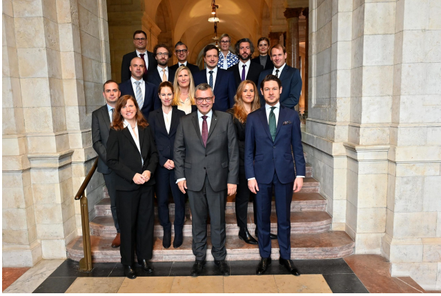
Photo de groupe du 29e cours de la formation en gestion administrative.