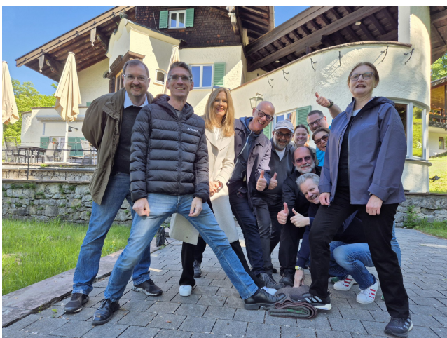
Participants du programme TOP Management.