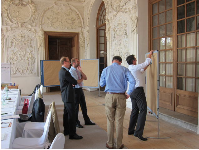
A la pointe du progrès – série de formation pour haut fonctionnaires bavarois en missions spéciales