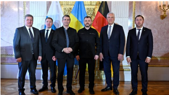
13. Sitzung der Ständigen bayerisch-ukrainischen Arbeitskommission ...

Bei Fragen zu Hilfsangeboten an die Ukraine wenden Sie sich bitte an