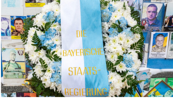
4. Jahrestag des russischen Angriffskrieges in der Ukraine