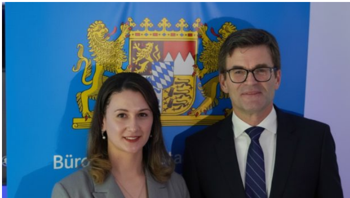
Weihnachtsempfang beim Büro des Freistaats Bayern in der Ukraine ...