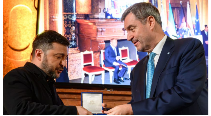
State Dinner anlässlich der MSC 2026