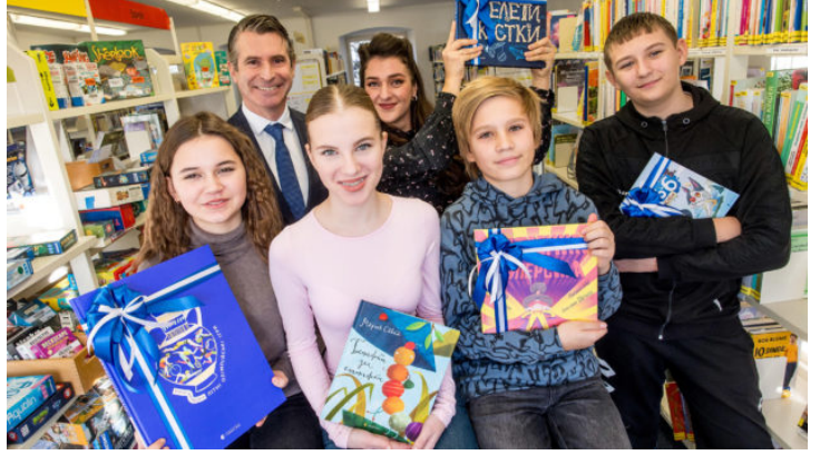
Українські дитячі книжки для міської ...