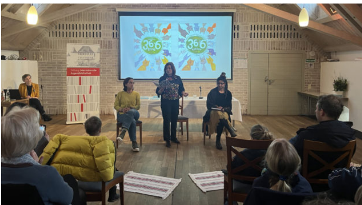
Заклучна подія дитячого книжкового ...

Бюро Вільної держави Баварія в Києві розпочало свою діяльність 5 березня 2018 року.