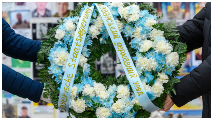
3-я річниця російського вторгнення ...