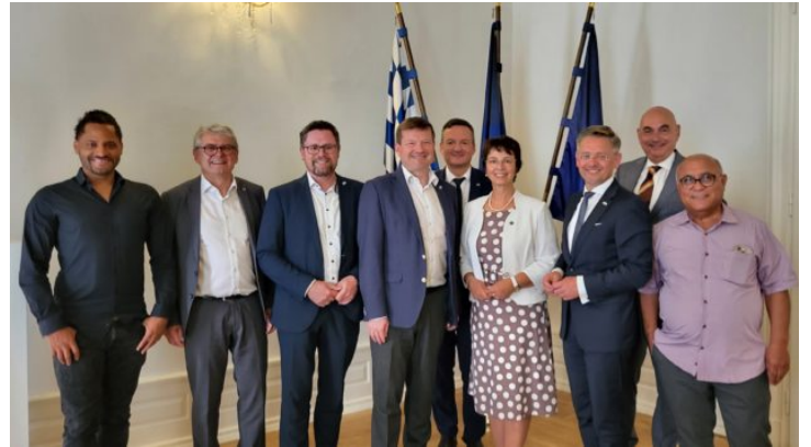
Europaausschuss des Bayerischen Landtags zu Besuch in Prag