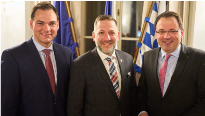
Bayerisch-tschechische Zusammenarbeit in der Grenzregion