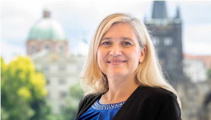
Europaministerin Huml in Prag