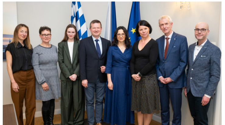
Podiumsdiskussion: Museumslandschaft zwischen öffentlicher ...