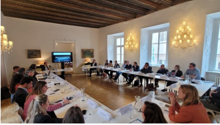
Fachaustausch mit der EUSPA