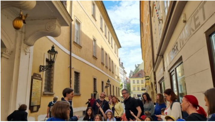
Bayern in Prag einmal anders