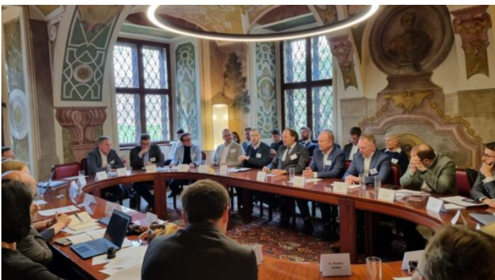
Grenzüberschreitender Dialog zum Thema „Artificial Intelligence ...