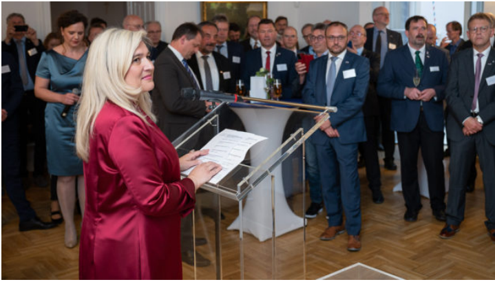
Bayerisch-tschechischer Tag der Kommunalpartnerschaften in Prag ...