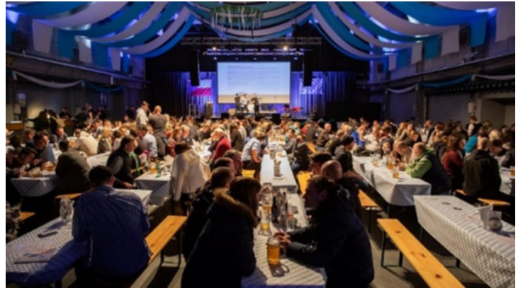
Bayerisch-böhmische Kultur | Kreativ | Tage in Pilsen