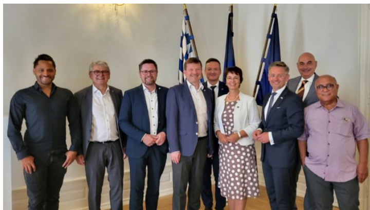
Europausschuss des Bayerischen Landtags zu Besuch in Prag