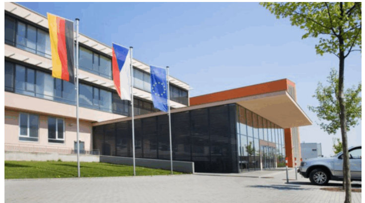
Zeitzeugengespräch an der Deutschen Schule Prag