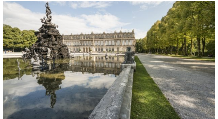
Vom Sofa nach Bayern: Führung durch das Schloss Herrenchiemsee ...