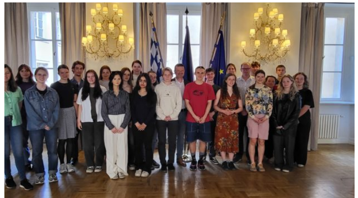
Bayerische und tschechische Schülerinnen und Schüler lernen ...