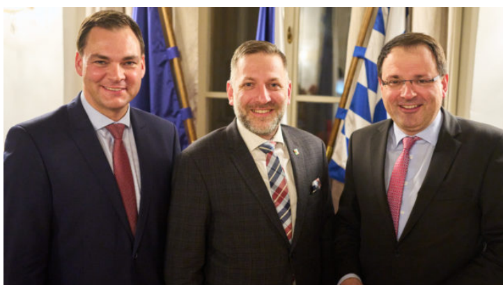
Bayerisch-tschechische Zusammenarbeit in der Grenzregion