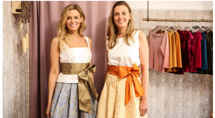
Und du so? Bayern und Tschechien im grenzenlosen Kultur-Austausch