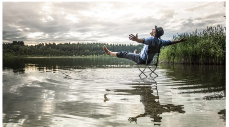
Bayern siebenmal anders: Batterien aufladen