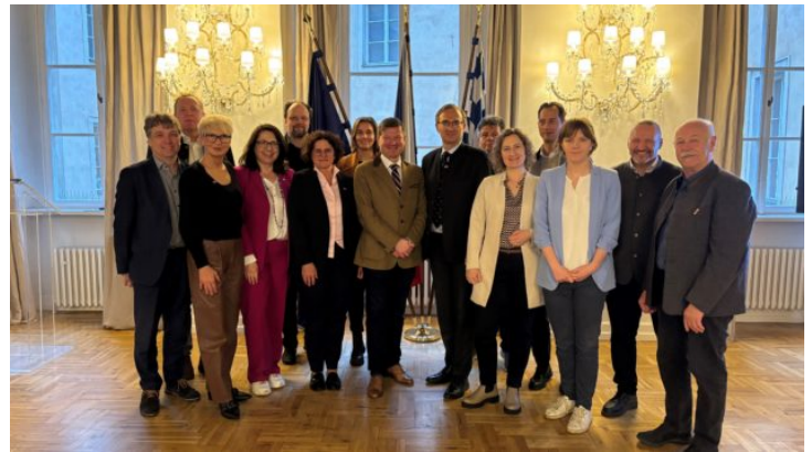
Ausschuss für Umwelt- und Verbraucherschutz des Bayerischen ...