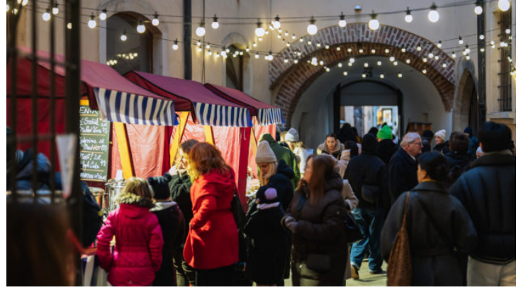
Adventsmarkt anlässlich 10 Jahre Bayerische Repräsentanz in ...

ubiläum 10 Jahre Repräsentanz des Freistaats Bayern in der Tschechischen Republik