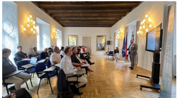
Bavarian-Czech AI and Robotics Workshop