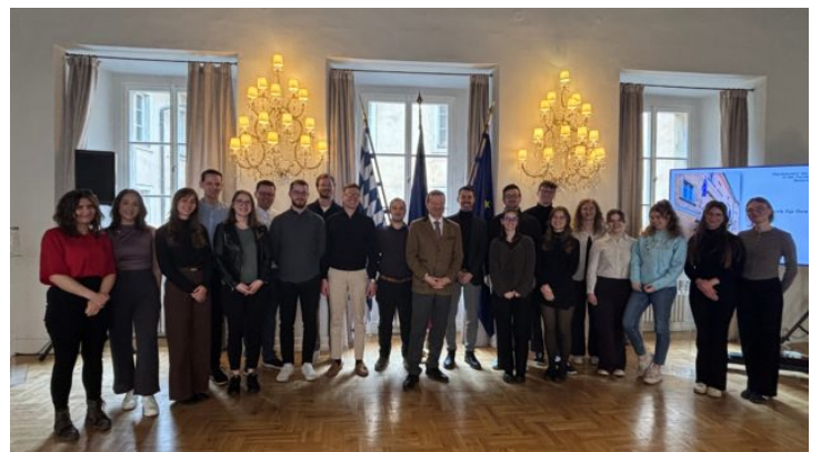
Besuch von Referendaren des Landgerichts Bamberg