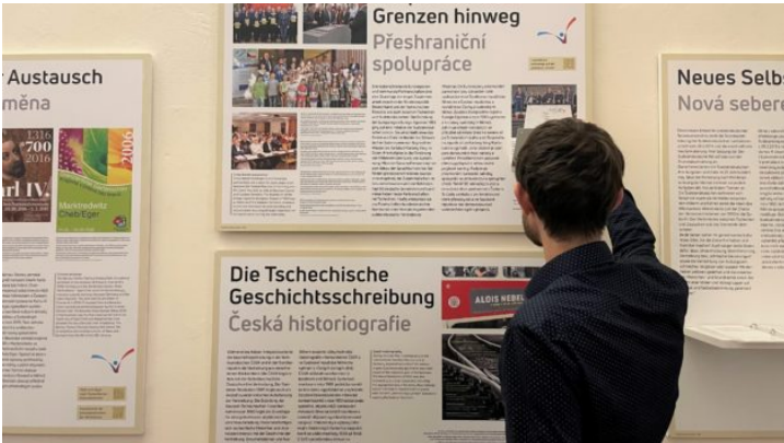
„So geht Verständigung – dorozumění“