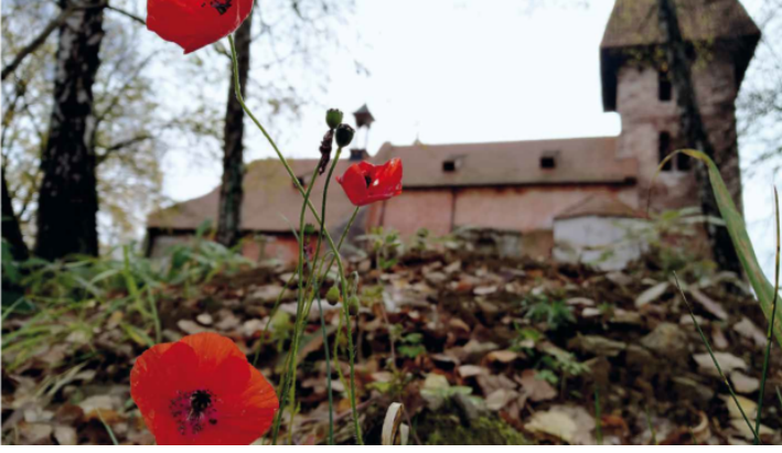
Ausstellung „Verblichen, aber nicht verschwunden“