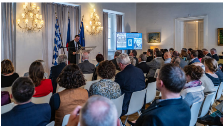
Zweite bayerisch-böhmische Soirée