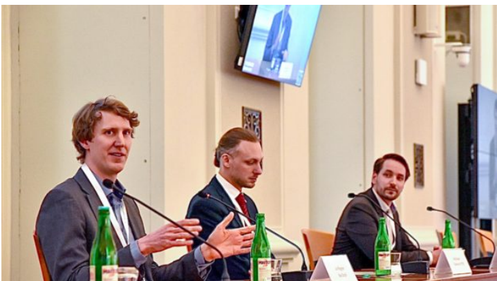
Deutsch-tschechischer Wasserstofftag in Prag