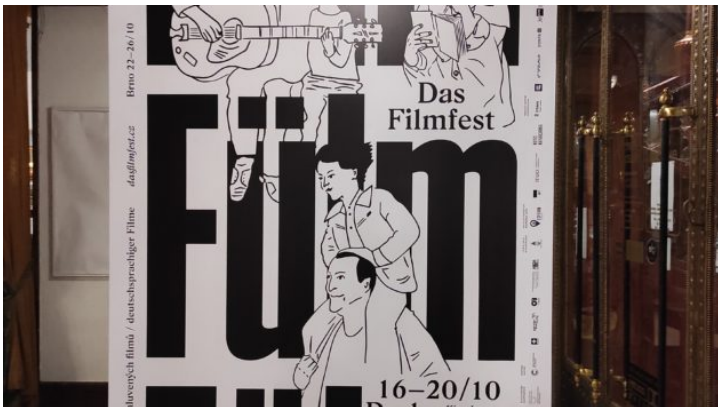
Festival deutschsprachiger Filme Das FILMFEST