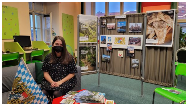
Lebendige Bibliothek für Schüler in Slaný (Schlan)