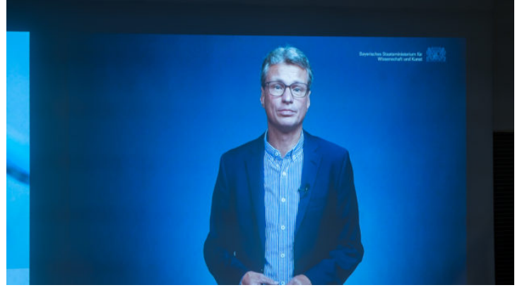
„Pathways into a Sustainable Future“: Konferenz zu grünen ...