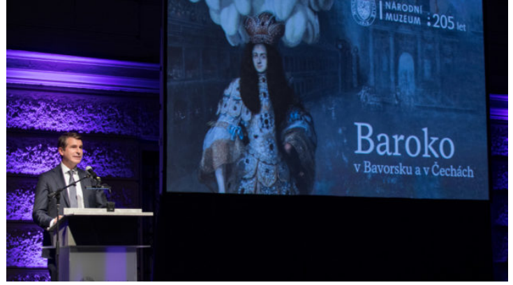
Eröffnung der bayerisch-tschechischen Landesausstellung in ...