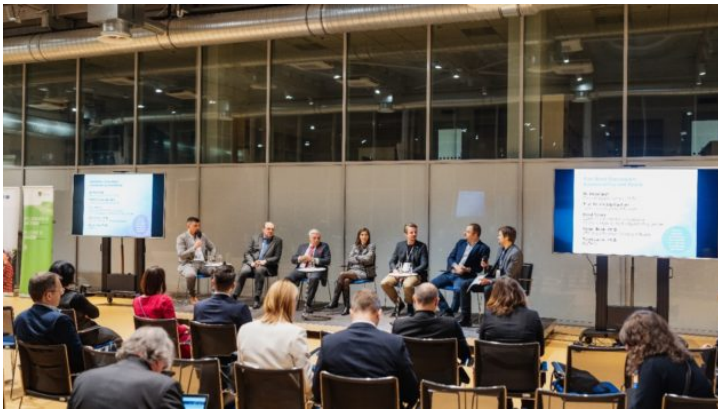
Netzwerktreffen „Sustainability and Space“ in Prag