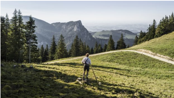
Vom Sofa nach Bayern: Alphornkonzert