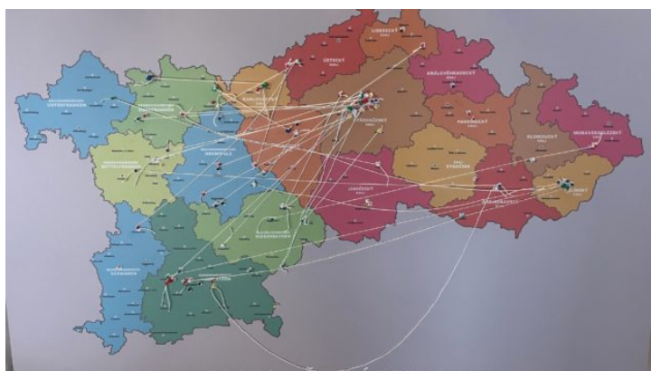
Zweites bayerisch-tschechisches Lehrer-Netzwerktreffen