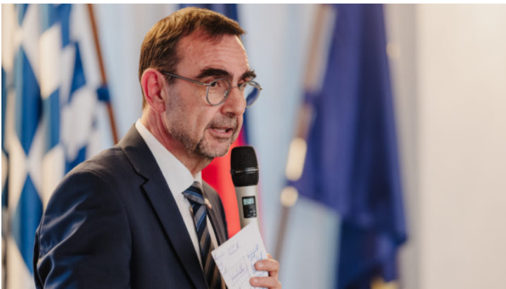
Kamingespräch mit Klaus Holetschek, MdL