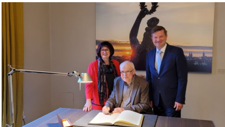
Vernissage der Ausstellung „Böhmen liegt nicht am Meer - ...