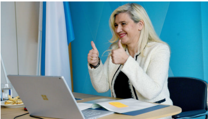
Nachbarsprache im O-Ton