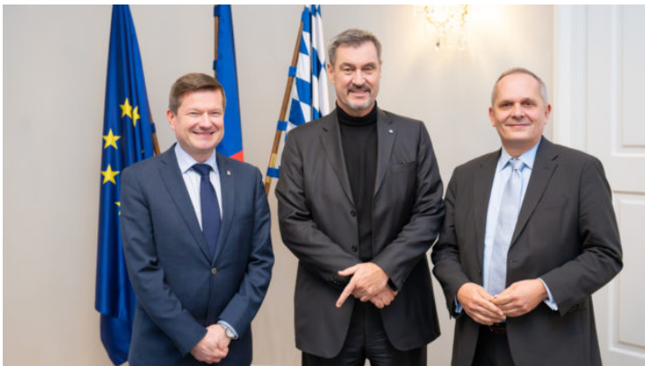
Besuch des Bayerischen Ministerpräsidenten in der Repräsentanz