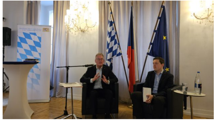
Literarischer Abend zum Prager Kreis und Johannes Urzidil