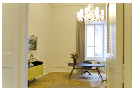
Räumlichkeiten der Bayerischen Repräsentanz in Prag.

Die Repräsentanz des Freistaats Bayern in Tschechien gewährt Besuchergruppen gerne Einblick in ihre Arbeit vor Ort.