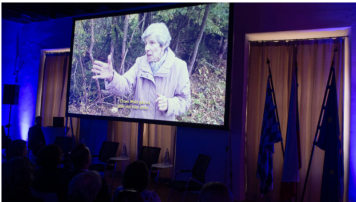
„Das Licht für die Zukunft / Světlo pro budoucnost“: Filmpremiere ...