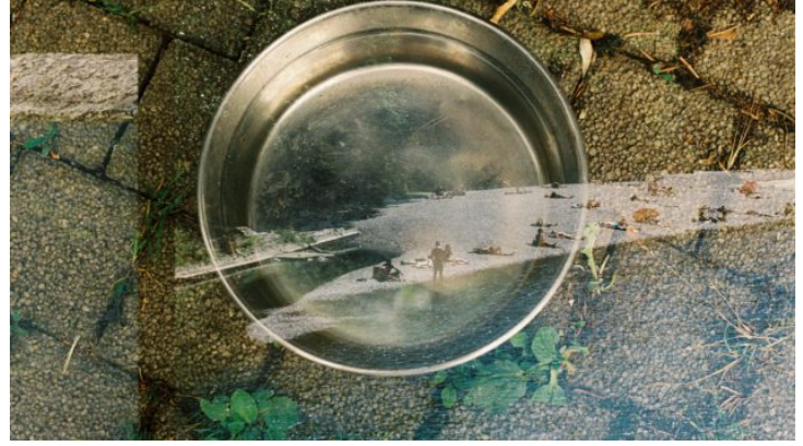
„Auf den zweiten Blick | Na druhý pohled“ Ein Fotoaustausch ...