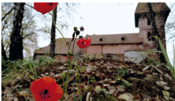
Výstava „Vybledlé, ale ne ztracené“