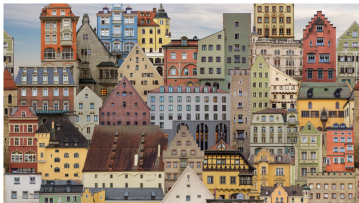
Proměněné fotografie – výstava umělkyně Leny Schabus