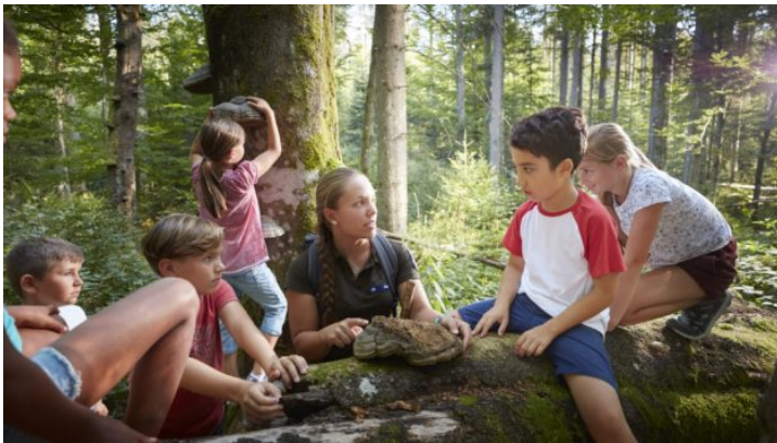
Bavorsko z pohodlí domova: Procházka po Národním parku Bavorský ...