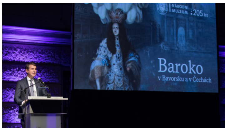
Zahájení česko-bavorské zemské výstavy v Praze