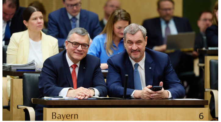
Sitzung des Bundesrates am 27. März 2026