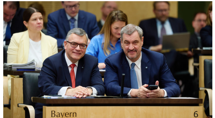
Ministerpräsident Dr. Markus Söder: „Wir sagen hohen Spritpreisen den Kampf an“