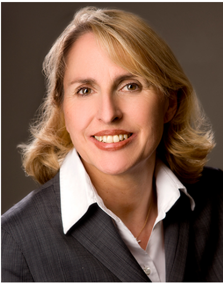
Porträt: Staatsrätin Karolina Gernbauer

An der Spitze der Vertretung steht Staatsrätin Karolina Gernbauer als Bevollmächtigte des Freistaates Bayern beim Bund .