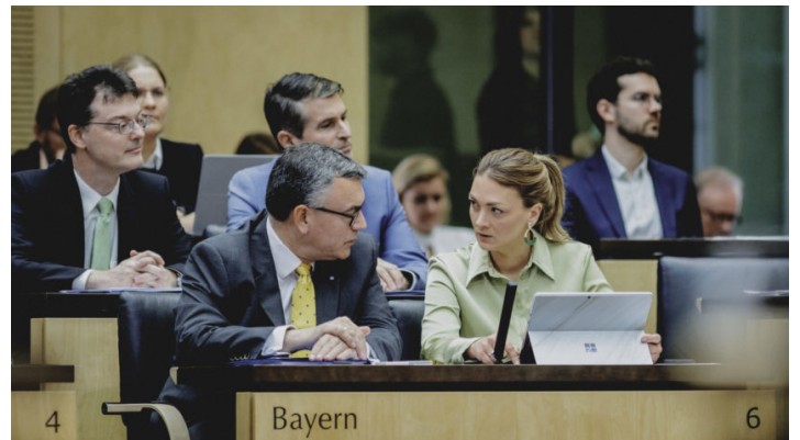
Sitzung des Bundesrates am 22. November 2024