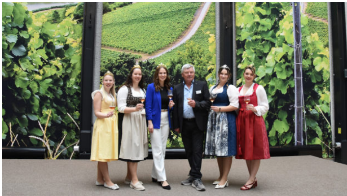
Die Zeit ist reif für Frankenwein / Schlenderweinprobe