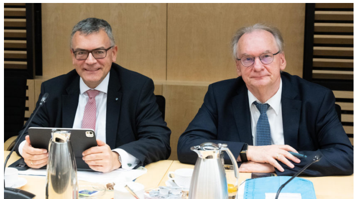
Vermittlungsausschuss im Bundesrat am 17.12.2025

Ministerpräsident Dr. Markus Söder: „Der Bundesrat hat heute konkrete Entlastungen für Millionen Menschen in Deutschland beschlossen“