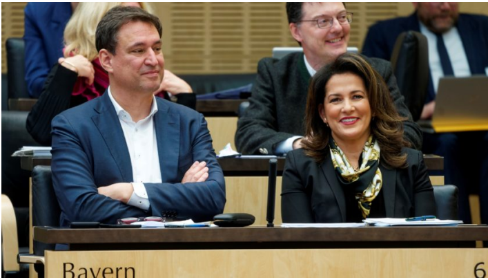
Sitzung des Bundesrates am 15. Dezember 2023

Agrardiesel / Weiterentwicklung Bürgergeld / Modernisierung Staatsangehörigkeitsrecht und Rückführungsverbesserungsgesetz