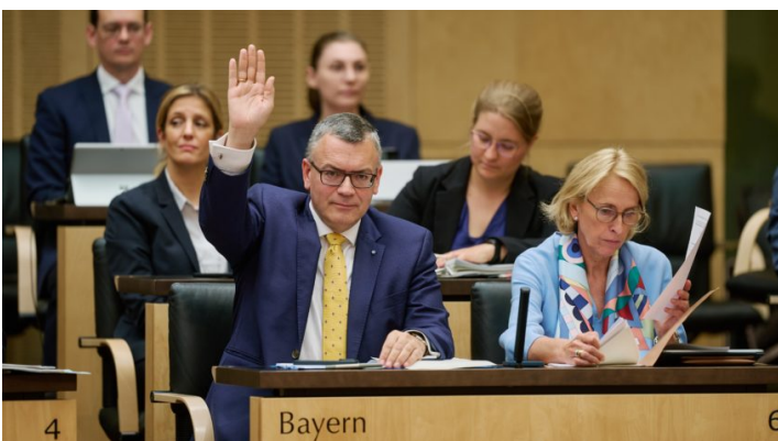
Sitzung des Bundesrates am 13. Juni 2025

Ministerpräsident Dr. Markus Söder zum Investitionsbooster: Deutschland startet eine Aufholjagd für Aufschwung