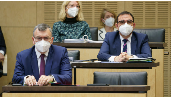
Sitzung des Bundesrates am 17. Dezember 2021

Sondersitzung zu weiteren Corona-Maßnahmen / Weg frei für neue Quarantäneregelungen