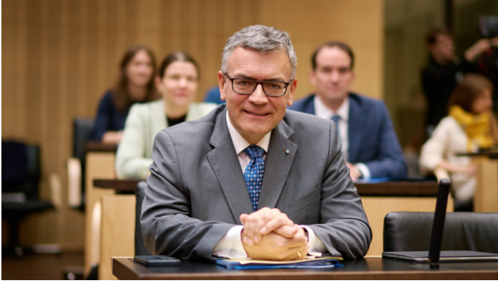
Sondersitzung des Bundesrates am 24. April 2026