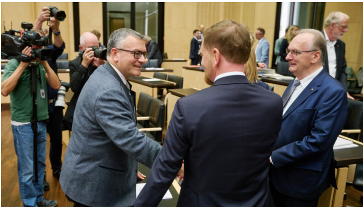
Sitzung des Bundesrates am 26. September 2025