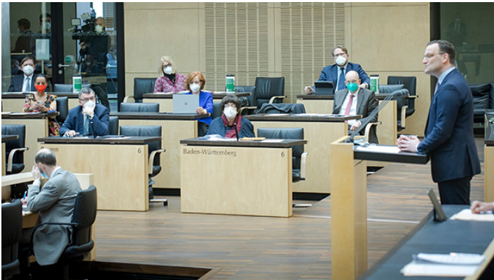
Sondersitzung des Bundesrates am 22. April 2021

Erleichterungen für Geimpfte und Genesene