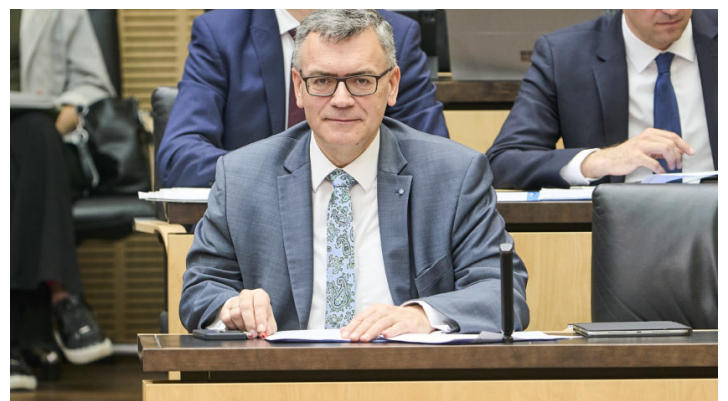
Sitzung des Bundesrates am 11. April 2025