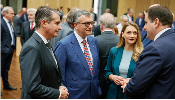
Sitzung des Bundesrates am 21. November 2025

Kernanliegen, die Beiträge für die Gesetzliche Krankenversicherung stabil zu halten, ist gewahrt."