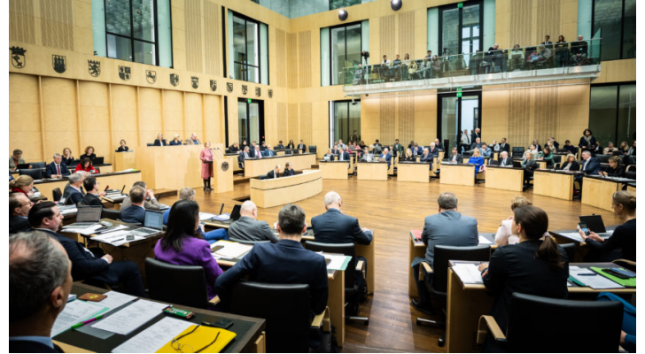
Sitzung des Bundesrates am 14. Februar 2025