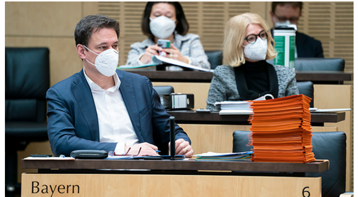
Sitzung des Bundesrates am 26. März 2021

Bundesrat billigt bundesweite verbindliche Corona-Notbremse