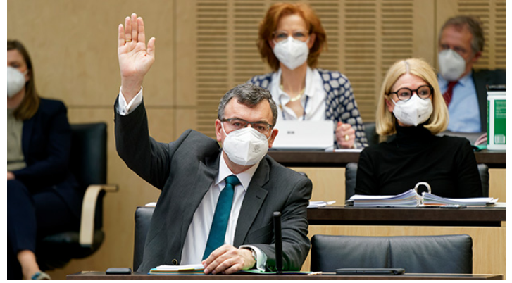
Sitzung des Bundesrates am 7. Mai 2021

Mehr Klimaschutz und Ausbau Ganztagsförderung