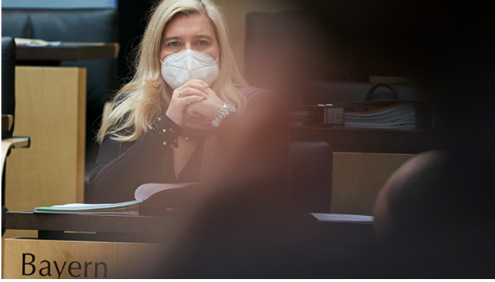
Sitzung des Bundesrates am 28. Mai 2021

Mehr Klimaschutz und Ausbau Ganztagsförderung