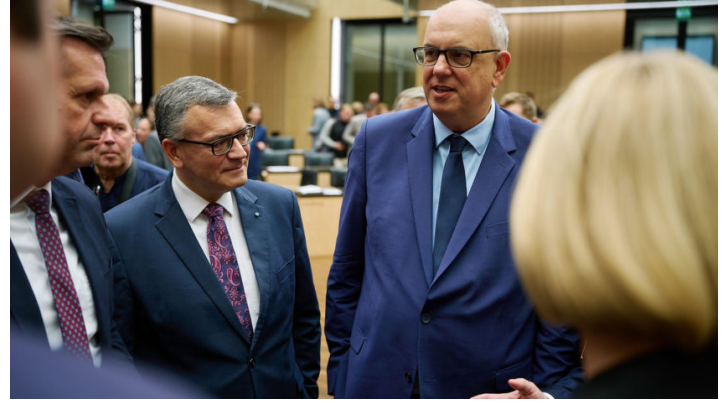
Sitzung des Bundesrates am 17. Oktober 2025