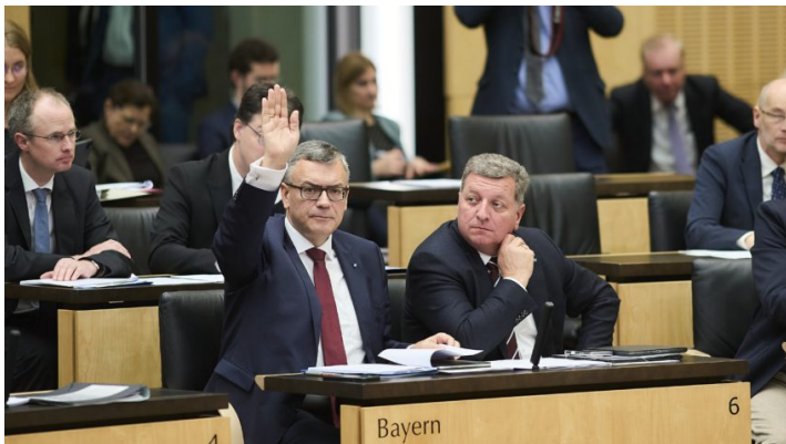
Sitzung des Bundesrates am 20. Dezember 2024

Bayerische Initiativen für eine klare Wende in der Migrationspolitik / Bundesrat beschließt bayerische Initiative für gesamtstaatliches Zusammenstehen bei Hochwasserschäden