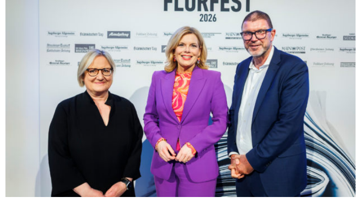
Flurfest der Augsburgers Allgemeinen