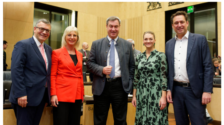
Sitzung des Bundesrates am 24. November 2023

Bayerischer Antrag für dauerhafte Senkung der Gastronomie-Steuer / Wachstumschancengesetz / Kindergrundsicherung / Rückführungsverbesserungsgesetz