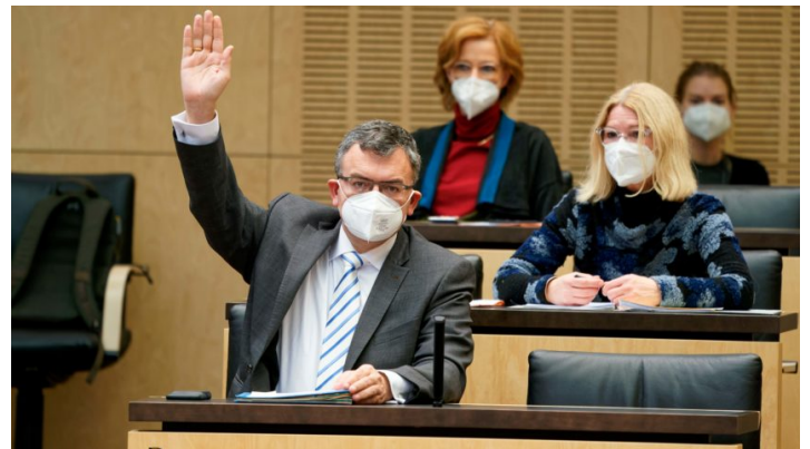
Sitzung des Bundesrates am 10. Dezember 2021

Bayern fordert Gehaltsverdoppelung für Intensivpflegekräfte