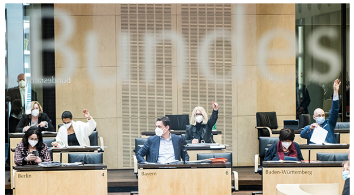
Bundesrat am 5. März 2021