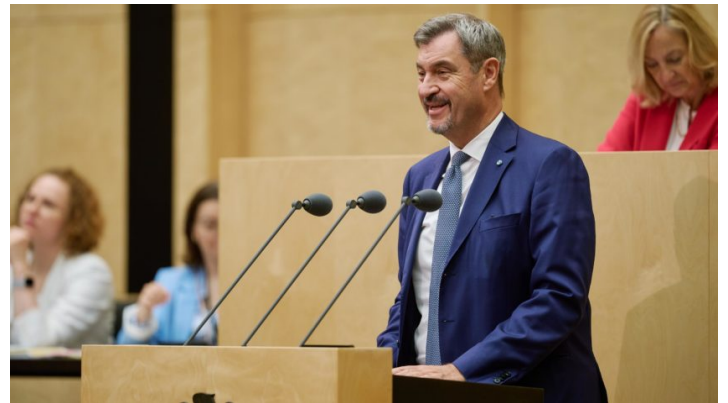
Sitzung des Bundesrates am 11. Juli 2025