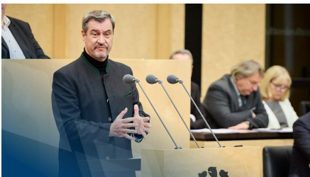
Ministerpräsident Dr. Markus Söder bei einer Rede im Bundesrat.

Ausgehend vom Bundesrat als Länderkammer begleitet die Vertretung schwerpunktmäßig die Gesetzgebung des Bundes. Jedes Bayerische Staatsministerium entsendet eine Verbindungsreferentin bzw. einen Verbindungsreferenten zur Beobachtung der Politikthemen des jeweiligen Ressorts in Berlin.