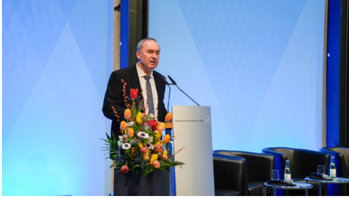
Parlamentarischer Abend zum Thema „Unabhängigkeit der Freien ...