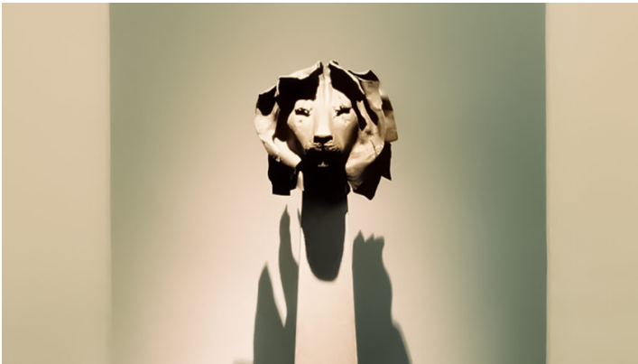
Löwenkopf von Hubertus von Pilgrim