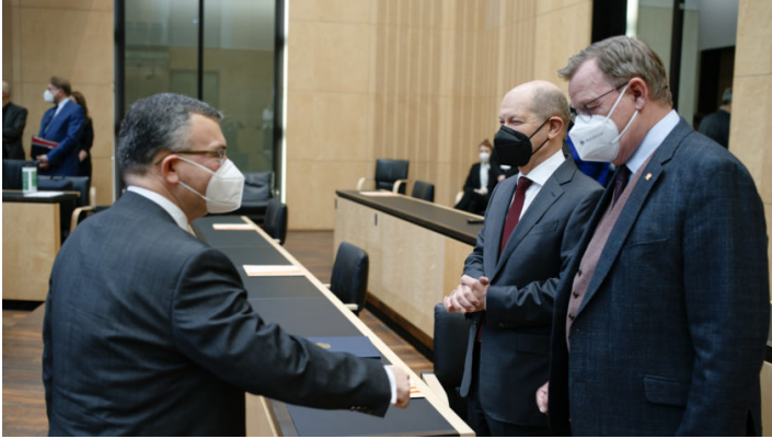
Sitzung des Bundesrates am 11. Februar 2022

Ukraine-Debatte / Bayerische Initiative für ein Sofortprogramm zur Neuausrichtung der Bundeswehr und Reform der Sicherheitsarchitektur / Weitere bayerische Initiativen für eine absolute Energiepreisbremse und zur Bekämpfung der Kinderpornografie