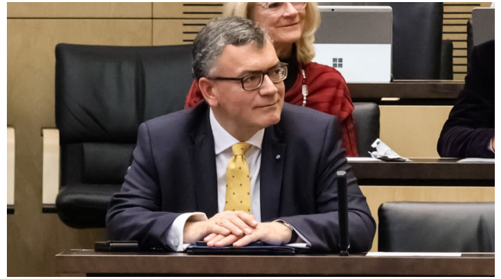
Sitzung des Bundesrates am 7. Dezember 2023

Nachtragshaushalt 2023 / Bayerische Initiativen u.a. Weiterentwicklung Bürgergeld, Schutz der bäuerlichen Rinderhaltung, Schutz der Weidetierhaltung vor wachsender Wolfspopulation, rechtssichere Bezahlkarte für Asylbewerber