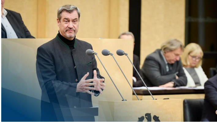
Sitzung des Bundesrates am 21. März 2025

Investitionssofortprogramm der Bundesregierung – die Wirtschaft braucht diesen Investitionsbooster dringend als Wachstumsimpuls.