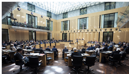
Plenarsitzung des Bundesrates.