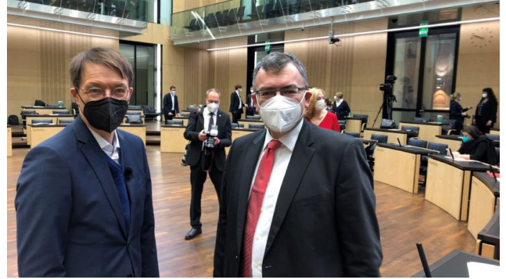
Sitzung des Bundesrates am 14. Januar 2022

Antrittsrede von Bundeskanzler Scholz im Bundesrat / Bayern bringt Initiativen u.a. zu Wohnungsbau ein