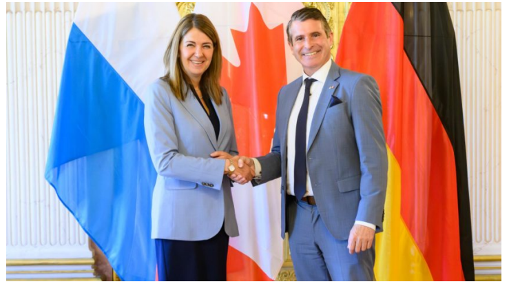
Gespräch mit Danielle Smith, Premierministerin von Alberta