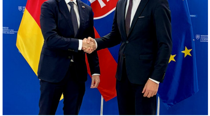
Europaminister Beißwenger in Bratislava