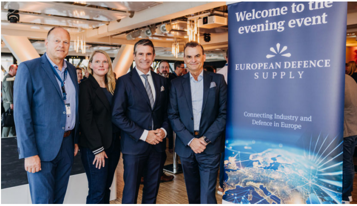
European Defence Supply Conference