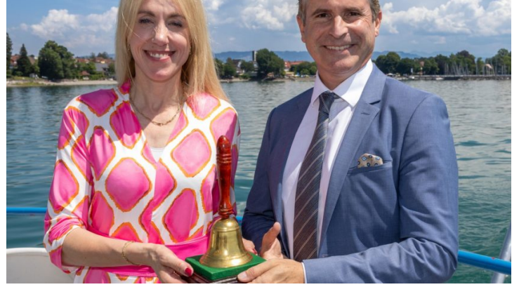
Wechsel des EMK-Vorsitzes