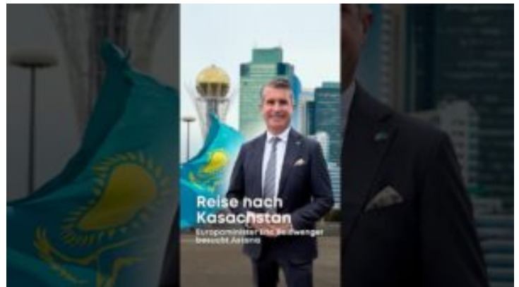
Reise nach Zentralasien: Besuch der Republik Kasachstan ☐☐ ...