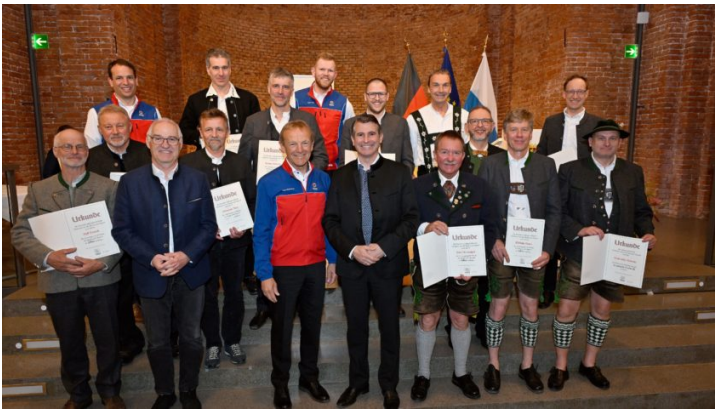
Leistungsauszeichnungen für besondere Verdienste um die Bergwacht ...