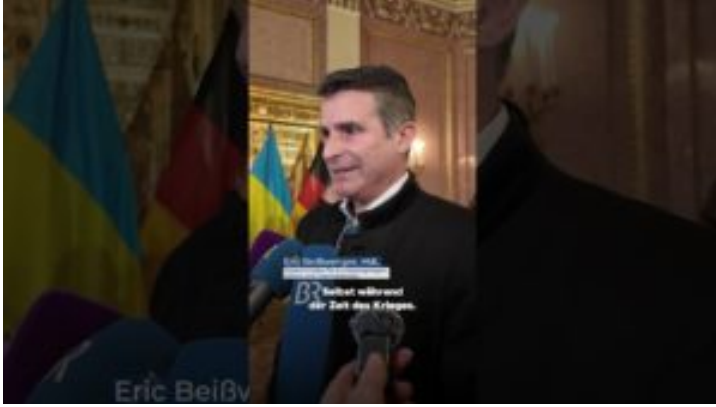
13. Sitzung der Bayerisch-Ukrainischen Arbeitskommission - ...