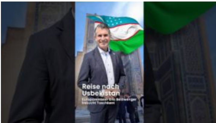
Reise nach Zentralasien: Besuch der Republik Usbekistan ☐☐ ...