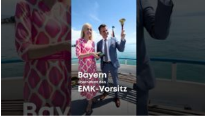
EMK-Vorsitz – Bayern