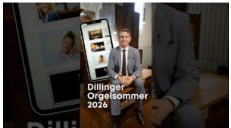
Dillinger Basilikakonzerte - Bayern