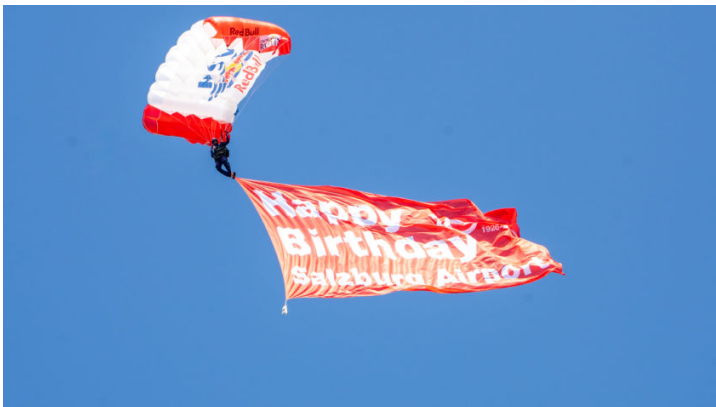
100 Jahre Salzburg Airport