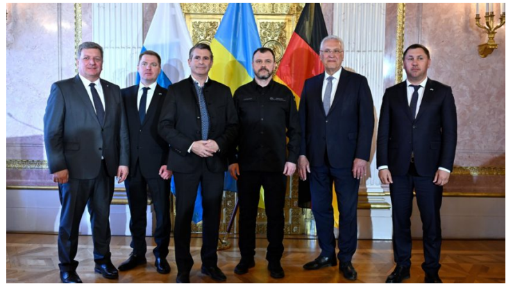
13. Sitzung der Ständigen bayerisch- ukrainischen Arbeitskommission ...