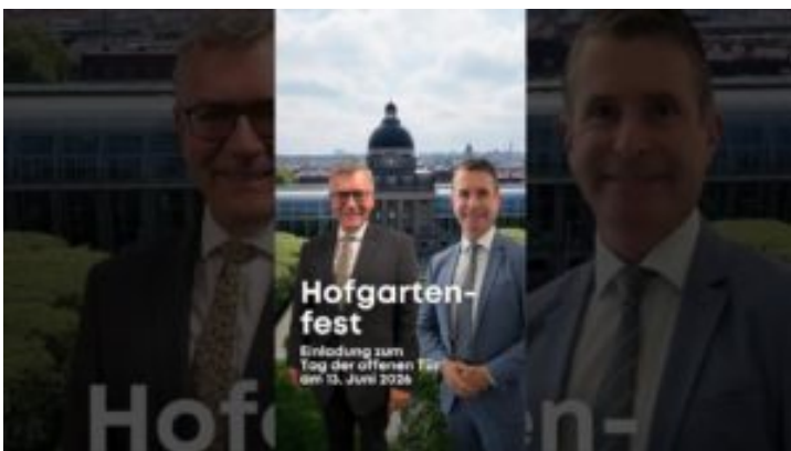
Hofgartenfest und Tag der offenen Tür am 13. Juni 2026 – ...