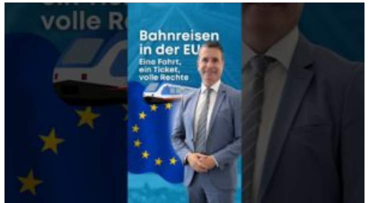
Bahnreisen in der EU- Bayern