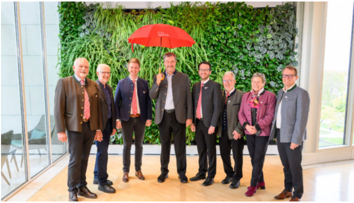
Andienung Schirmherrschaft zu 1250 Jahre Stadt Vilshofen a.d ...