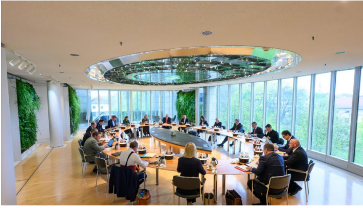
Kabinettsitzung am 14. April 2026