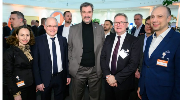
Neujahrsempfang der mittelständischen Wirtschaft