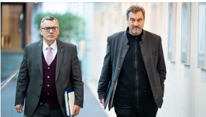
Kabinettsitzung am 13. Januar 2025