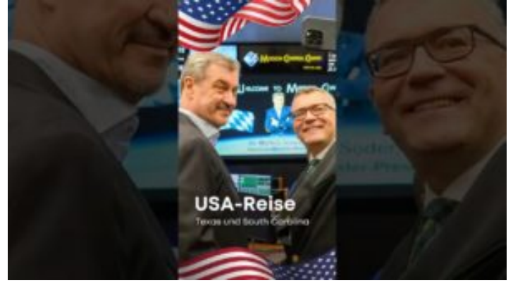
Highlights der USA-Reise in Texas und South Carolina - ...