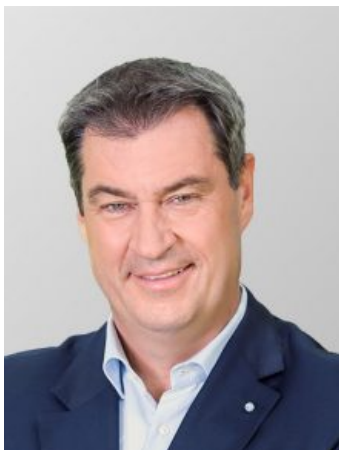
Dr. Markus Söder, MdL