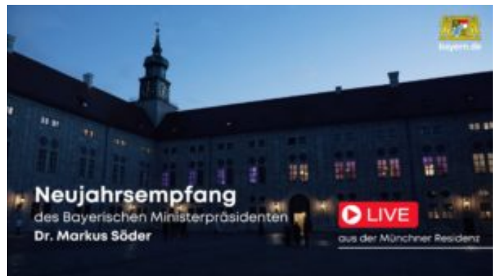
Neujahrsempfang des Bayerischen Ministerpräsidenten (10.01.2025) ...