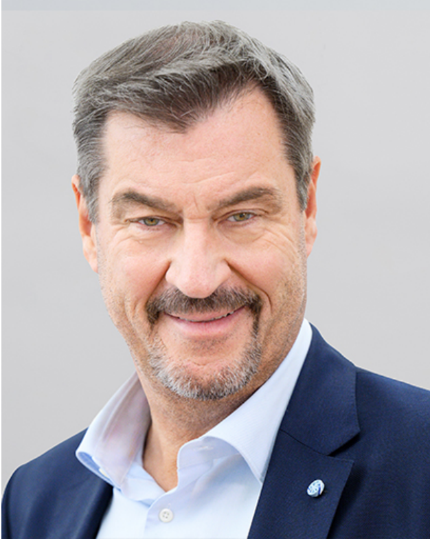
Porträt: Dr. Markus Söder, MdL

Geboren am 5. Januar 1967 in Nürnberg, verheiratet, vier Kinder