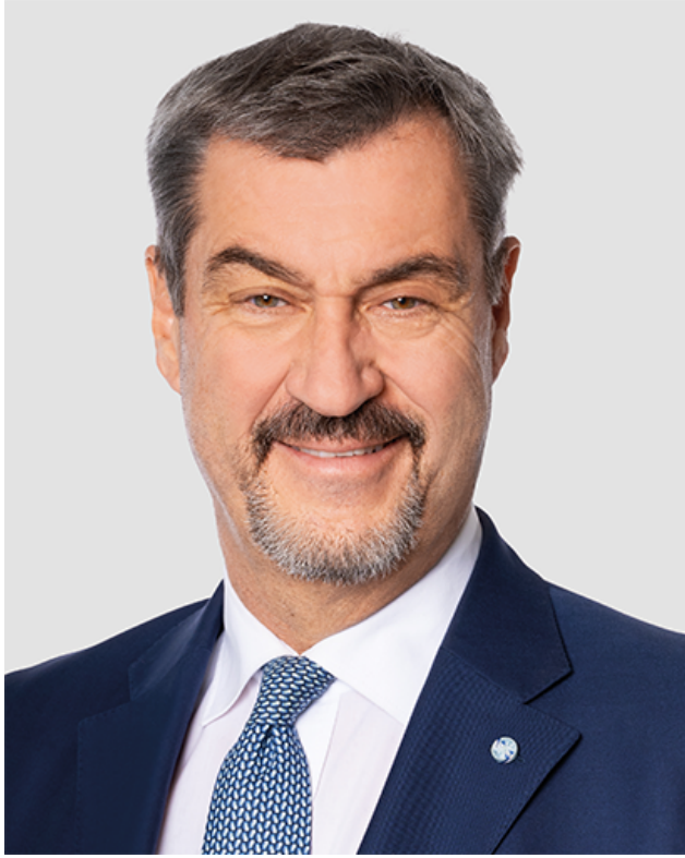
Porträt: Dr. Markus Söder, MdL

Geboren am 5. Januar 1967 in Nürnberg, verheiratet, vier Kinder