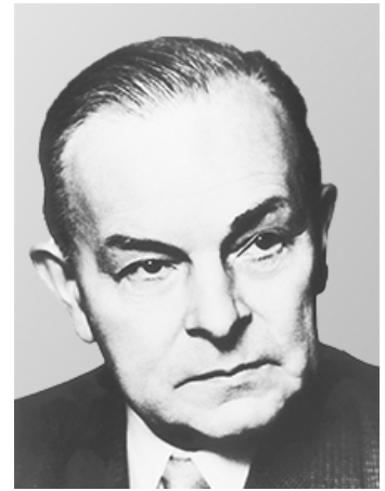
Dr. h. c. Max Streibl