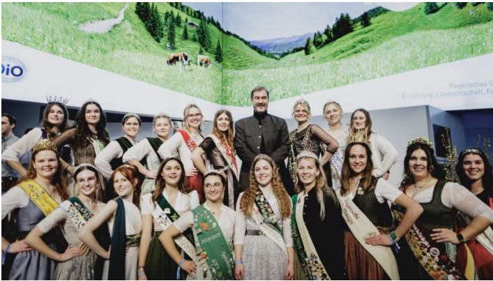
Staatsempfang anlässlich Internationale Grüne Woche 2025