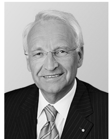
Dr. Edmund Stoiber