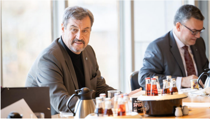
Kabinettsitzung am 21. Januar 2025