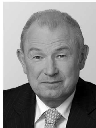
Dr. Günther Beckstein