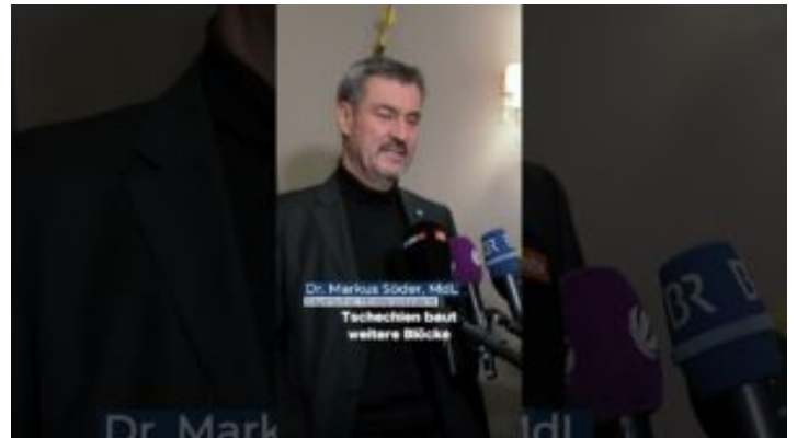
Weihnachtsgrüße von Ministerpräsident Dr. Markus Söder – ...