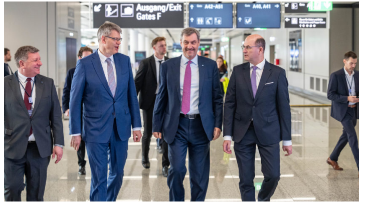
Eröffnung des neuen Terminal 1-Piers am Flughafen München