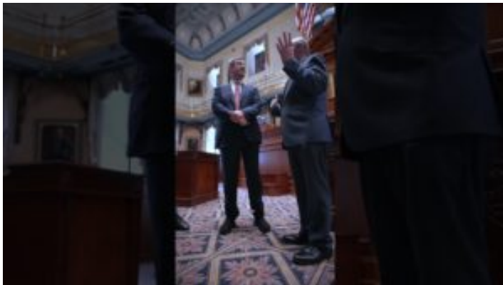
USA-Reise: Gespräche im State House South Carolina - ...