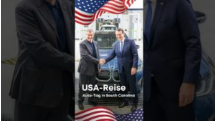
USA-Reise: Auto-Tag in South Carolina - Bayern