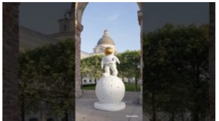
Rückblick: USA-Reise in Texas und South Carolina – Bayern ...