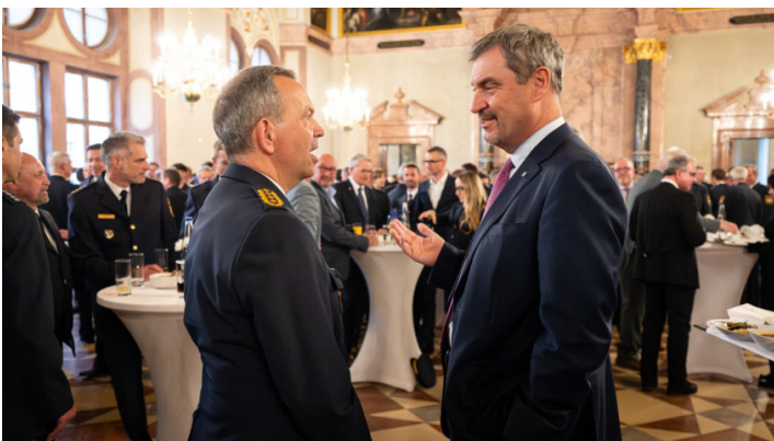
Empfang mit Führungskräften der Bayerischen Polizei