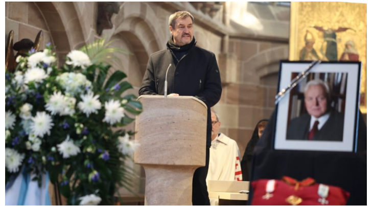
Gedenkgottesdienst für Bundesminister a.D. Dr. Oscar Schneider ...