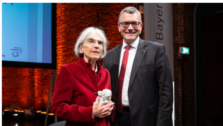
Bayerischer Buchpreis 2024