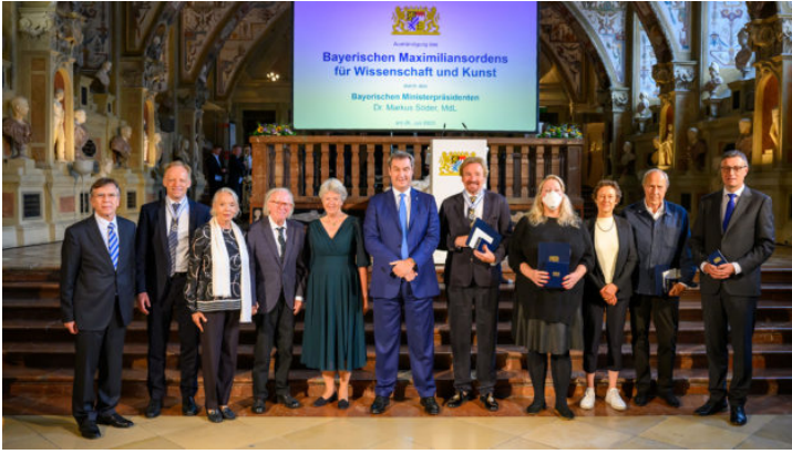
Verleihung des Bayerischen Maximiliansordens 2023