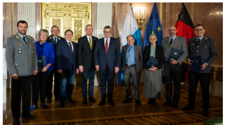
Verleihung der Europa-Medaille 2024