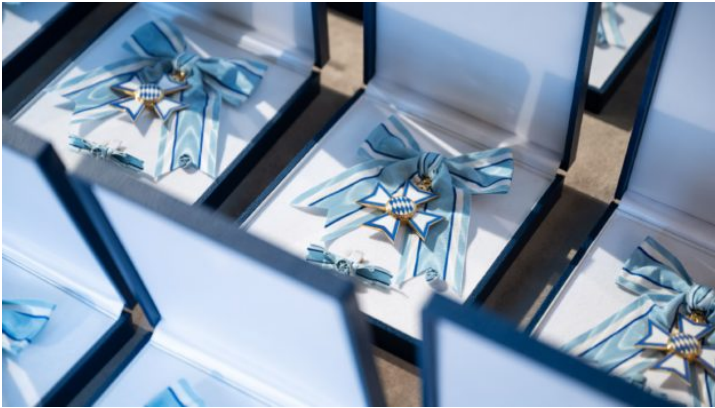
Bayerischer Verdienstorden 2024