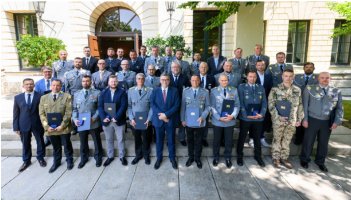
Verleihung der Bayerischen Rettungsmedaille und Christophorus-Medaille ...