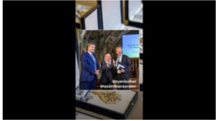
Verleihung des Bayerischen Maximiliansordens - Bayern