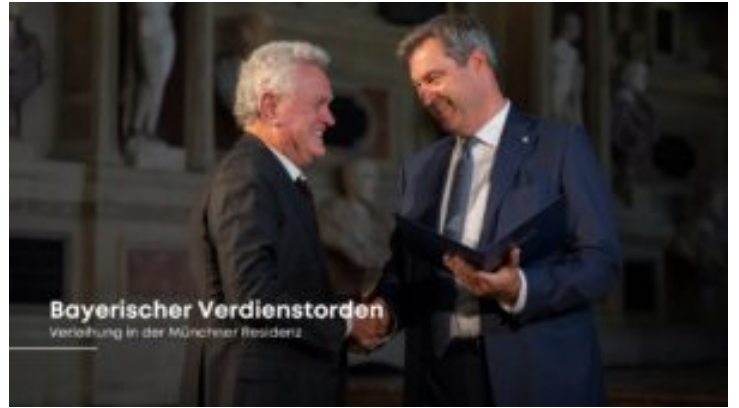
Verleihung des Bayerischen Verdienstordens im Antiquarium der ...