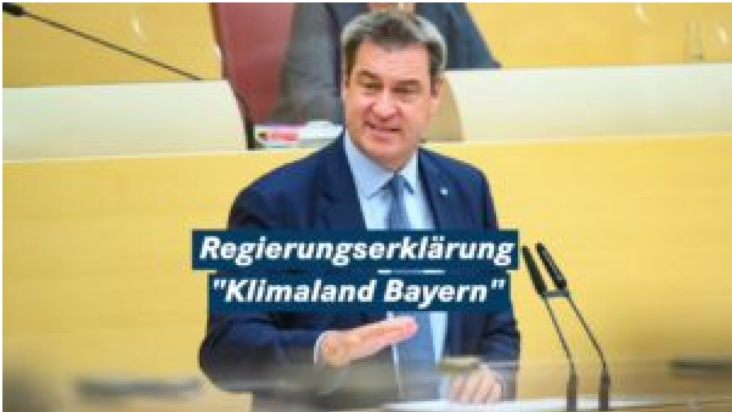
Regierungserklärung zum Klimaschutz (Kurzversion)